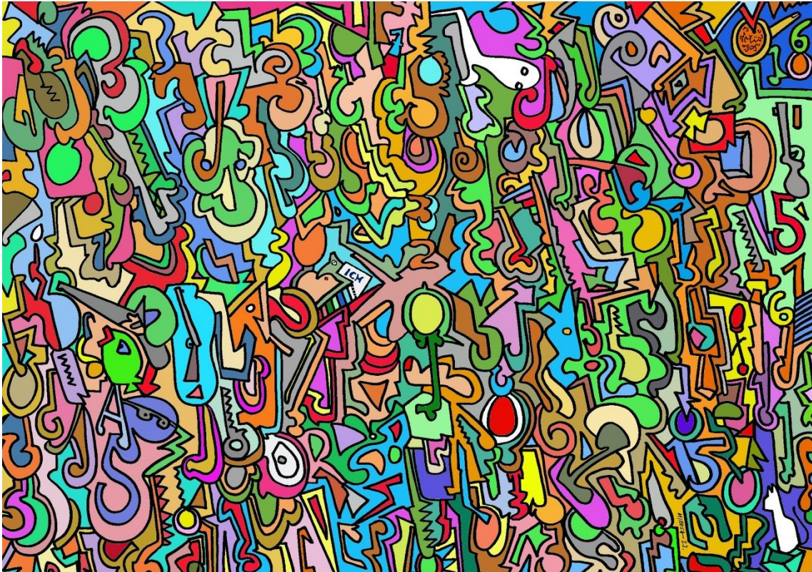
Puzle de Fractal Om 009 Taller de comprensión por desafectación

Por ejemplo, aquí en Tseyor hemos empezado una tanda, en este Taller de desafectación, con los oportunos Puzles. Los mismos nos van a servir para emplear nuestra mente, primeramente para familiarizarnos mucho más con el surrealismo, con la abstracción. No son dibujos, la mayoría, o coloridos o rasgos de tipo natural, figurativo, son muchas veces surrealistas, y eso obliga a la mente a reestructurarse de otra forma muy distinta a la actual.